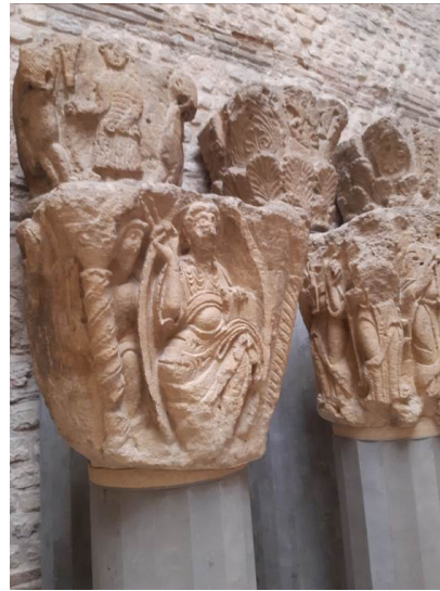
Chapiteau adossé : le Christ en majesté

La salle des émaux, explication de la technique sur émail cloisonné avec l'utilisation de fines lanières en métal sur la plaque de cuivre, ou bien la technique émail champ levé ; la plaque de cuivre est alors creusée (L'œuvre de Limoges correspond aux XII & XIIIème siècles) : de pures merveilles !